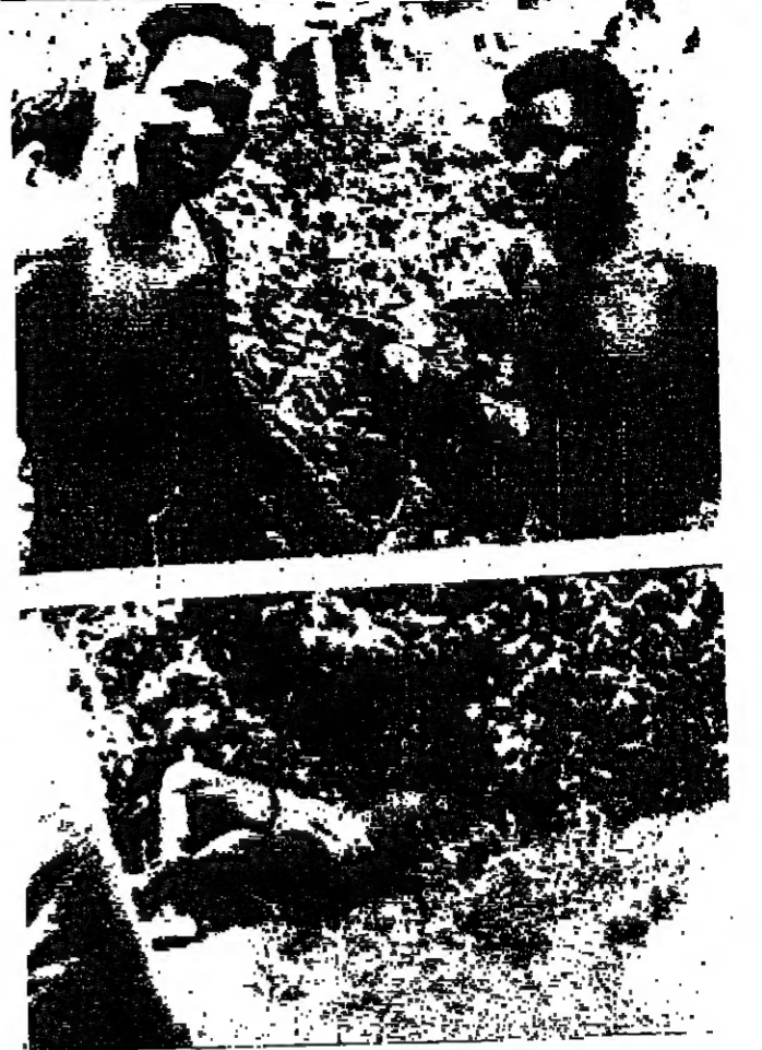
أربع صور مقلقة من فلسطين المحتلة... يجرى في إقليم يافرا المنشق... من أجزاء الإقليم سحب الضباب...